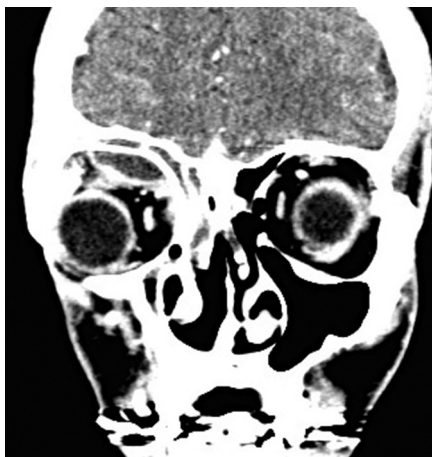
Obr. 4 Subperiostálny absces vpravo – axiálna projekcia.

diacej s prínosovými dutinami (obr. 3, 4). III. orbitálny absces – heterogénna denzita v oblasti orbitálneho tuku (5).