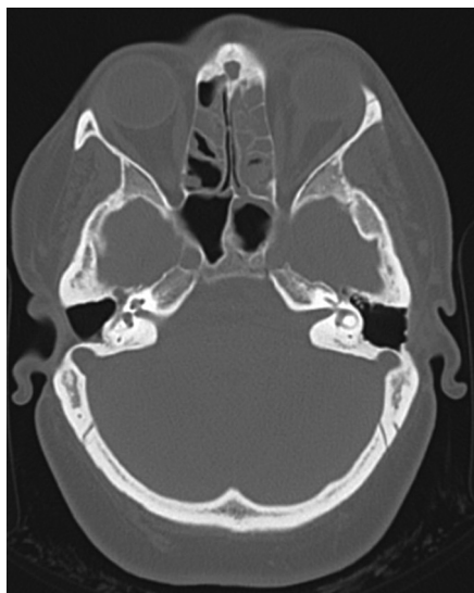
Obr. 2 Protrúzia očného bulbu vľavo.

lov, zhoršenie až strata zraku, meningizmus, postihnutie hlavových nervov. Monitorovanie očných príznakov u pacientov s orbitálnou komplikáciou je mandatorné, pretože ich progresia alebo ústup významnou mierou rozhoduje o liečbe. Progresia očného nálezu je rozhodujúca v indikácii chirurgickej liečby. V našom súbore z očných príznakov dominoval opuch viečka (100 %). Protrúzia bulbu (obr. 2), chemóza spojovky, obmedzenie pohyblivosti bulbu boli prítomné u 50 % pacientov – všetci pacienti s II. a III. stupňom orbitálnej komplikácie. Diplopia a sekundárny glaukóm bol len u jedného pacienta so subperiostálnym abscesom (12,5 %).