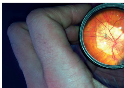
Obr. 4 Sítnice 24leté pacientky s myopickou degenerací zadního pólu levého oka před plánovanou operací strabismu.