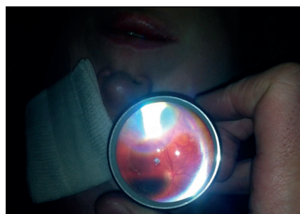
Obr. 5 a-b Učební křivka – snímky sítnice u 2 pacientů vyšetřených s odstupem měsíce: a – fyziologický nález na sítnici u 30leté ženy se strabismem (pořízeno v září 2013) b – snímek totální rhegmatogenní amoce sítnice u 64letého pacienta (pořízeno v říjnu 2013).