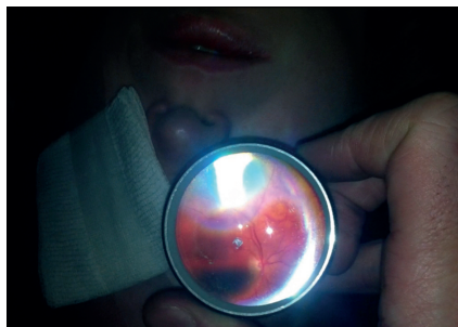
Obr. 5 a-b Učební křivka – snímky sítnice u 2 pacientů vyšetřených s odstupem měsíce: a – fyziologický nález na sítnici u 30leté ženy se strabismem (pořízeno v září 2013) b – snímek totální rhegmatogenní amoce sítnice u 64letého pacienta (pořízeno v říjnu 2013).