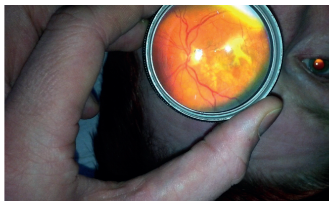
Obr. 3 Snímek centrální krajiny sítnice u 65letého pacienta s pokročilou formou věkem podmíněné makulární degenerace.