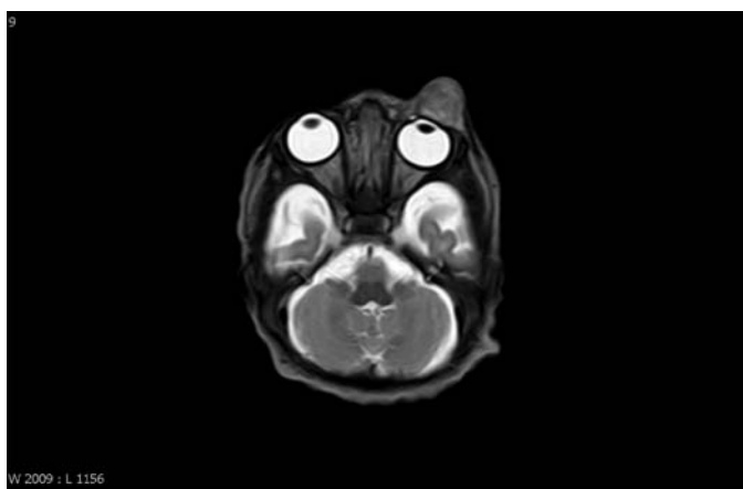
Obr. 8. MR mozku – 2. den po narození, velikost útvaru 10 x 4 x 6 mm.

Histopatologická diagnostika je založena na přítomnosti charakteristických buněčných znaků. Jsou to velké oválné až polygonální buňky s množstvím eozinofilní cytoplazmy, velkým vezikulárním jádrem s promínujícími jádérky a filamentózními cytoplazmatickými inkluzemi. Imunohistochemicky je důležitá pozitivní imunoreaktivita na vimentin, cytokeratin a epiteliální membránový antigen (1).