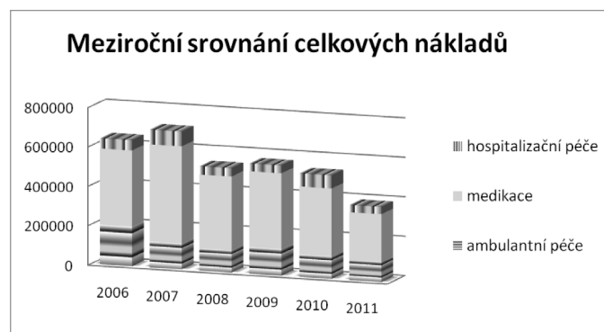
Graf 1. Meziroční tendence celkových nákladů

Zrak je nejdůležitějším lidským smyslem, jeho rozvoj probíhá od narození do