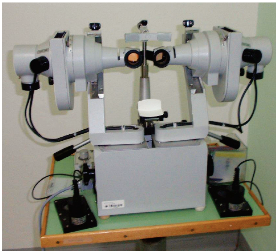
Obr. 1. Synoptofor firmy Sbisa

až 20° (tornívergence). Hurtová a spol. [3] uvádějí téměř tytéž hodnoty, ale v prizmatických dioptriích (pD). Při měření šířky fúze zjišťujeme stupeň konvergence a divergence, při kterém se rozpadá jednoduchý binokulární obraz. Sílu fúze můžeme hodnotit též podle rychlosti a snadnosti spojit diplopické obrazy. Fúze je určitelem JBV. Stereopsie je možná pouze v určitém omezeném trojrozměrném prostoru před a za fixační křivkou (horopterem). Jedná se o tzv. Panumův prostor. Podle Parkse [4] je minimální horizontální disparita, která vyvolává stereopsi 14 úhlových vte-