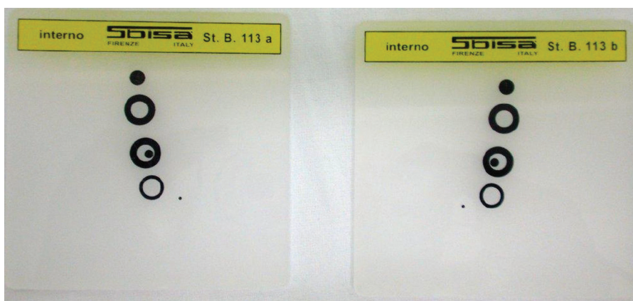
Obr. 4. Obrázky pro vyšetření stereopse na synoptoforu

Na synoptoforu vyšetřujeme JBV pacienta se správnou subjektivní refrakcí i bez ní. Pacienta pohodlně usadíme za přístroj a nastavíme pupilární distanci (PD). Zkontrolujeme správné umístění očí dle rohovkových reflexů (CR). Všechny stupnice na