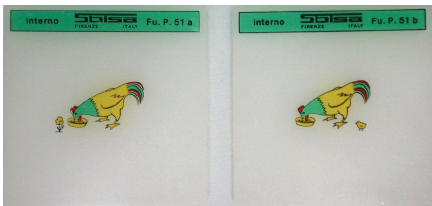
Obr. 3. Obrázky pro vyšetření fúze na synoptoforu

řin. Kvalita prostorové vjemu závisí kromě jiného na kvalitě a rozsahu fúze. Proto je důležité znát tento parametr JBV [1].