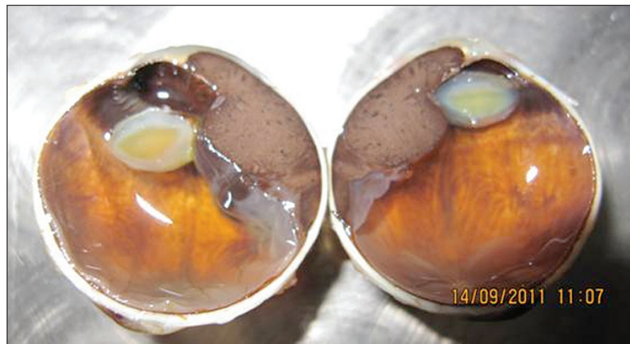
Obr. 1. Malígnym melanóm corpus ciliare v štádiu T3N0M0 so sublúxiou šošovky a prerastaním do prednej očnej komory

Okrem veľkosti ovplyvňuje prognózu aj tvar nádoru (obr. 1). Za agresívnejšie sa považujú difúzne formy rastu MMU, a v prípade MM dúhovky a corpus ciliare tiež prstencový rast nádoru.