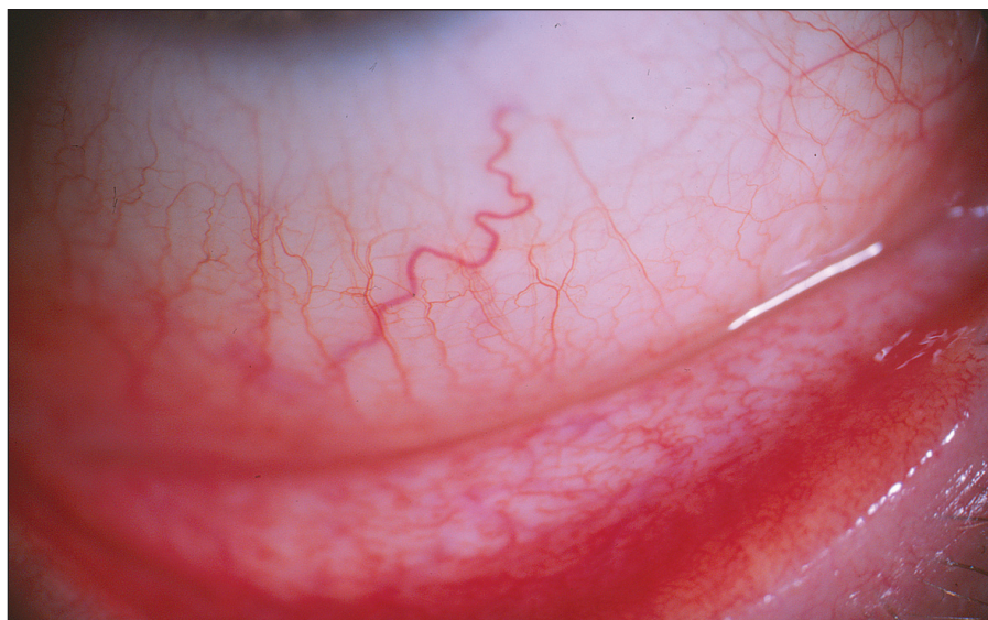
Obr. 2. Pacient č. 1: střední klinický nále z – zduření dolního fornixu s mírnou vinutostí cév bulbární spojivky a náznakem hyperémie

Folikulární záně t etiologie Ch. pneumoniae jsme léčili celkově podávaným makrolidovým (azalidovým) antibiotikem azithromycinem v dávce 500 mg denně po dobu 12 dní. (Oční infekci etiologie Ch. trachomatis jsme léčili stejným antibiotikem po dobu 7–9 dní, současně byl azithromycin 500 mg po dobu tří dnů podáván i sexuálním partnerům těchto pacientů.) U všech léčených osob byl kontrolní stěr ze spojivky tři měsíce po léčbě negativní, ale sérologický nále z se po šesti měsících od ukončení léčby téměř nezměnil. Po léčbě byl redukován nále z prosáknutí dolního fornixu s částečným ústupem hyperémie spojený současně s ústupem patologické sekrece. Subjektivní obtí že (řezání, pálení či pocit cizího tělí ska) provázené přechodnou hyperémií bulbární i tarzální spojivky přetrvávaly, ale byly menšího rozsahu, neboť