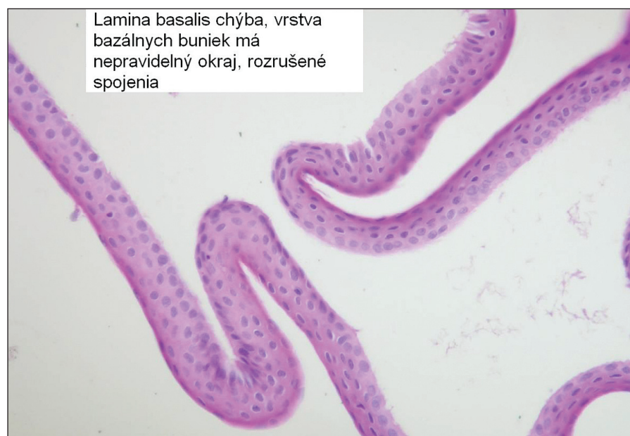
Obr. 2. Epitelialný flap vytvorený s pomocou alkoholu, lamina basalis nie je prítomná