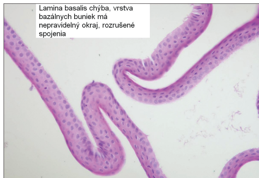
Obr. 2. Epitelialný flap vytvorený s pomocou alkoholu, lamina basalis nie je prítomná