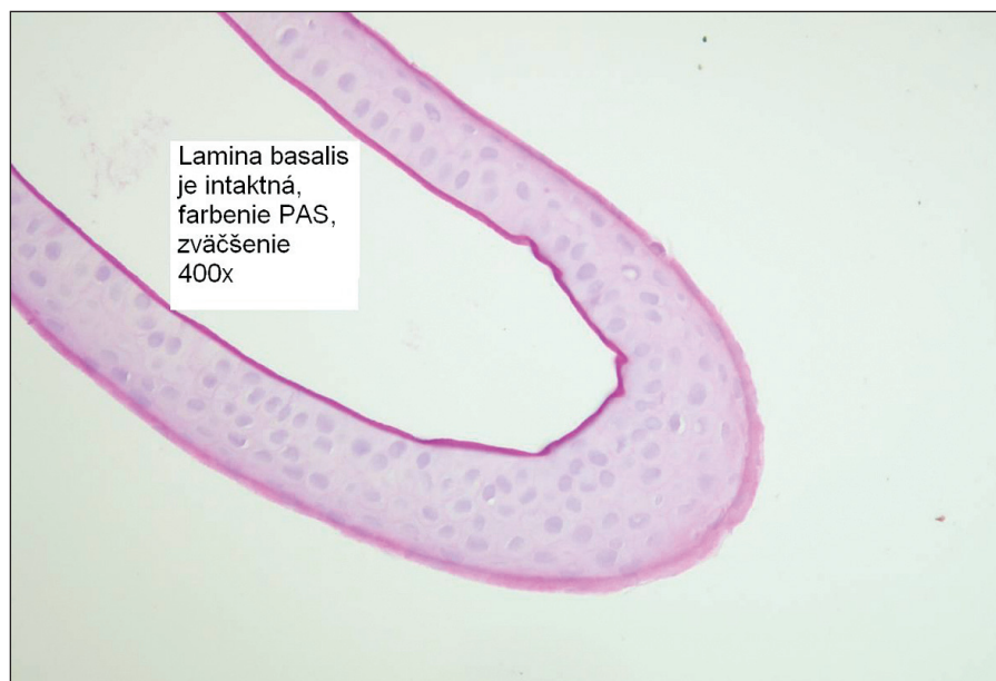
Obr. 3. Epiteliálny flap vytvorený iba mechanicky, lamina basalis je prítomná

nalý flap s jemnými iregularitami pozdĺž okrajov, 3 celý intaktný flap s trhlinami len na jeho okrajoch, 2 nepravidelný alebo voľný flap, 1 nekompletný, defektný flap.