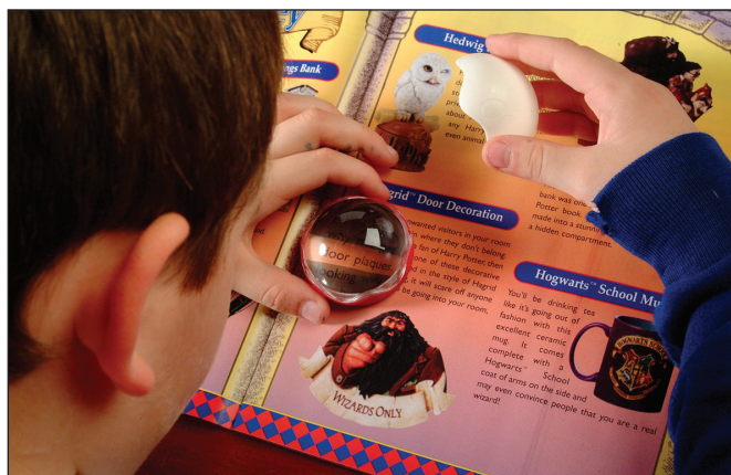
Obr. 8. Príložná lupa s riadkom