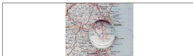
Obr. 7. Príložná lupa

Na základe analýzy získaných výsledkov sme zisťovali a posudzovali efektívnosť predpisovania optických pomôcok na kompenzáciu ZP u detí.