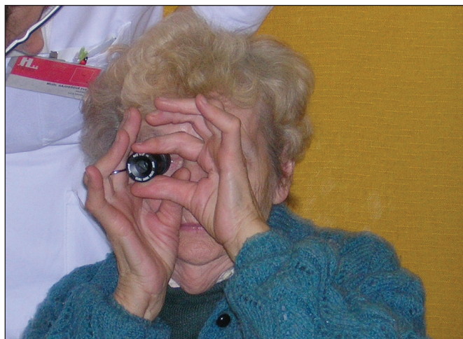
Obr. 1. Teleskop