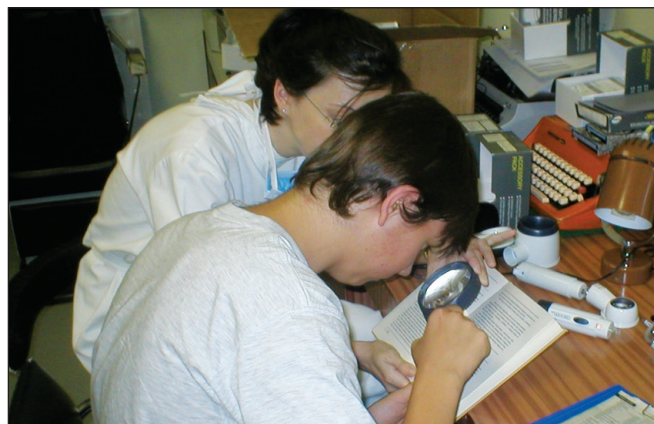
Obr. 11. Ručná lupa bez osvetlenia