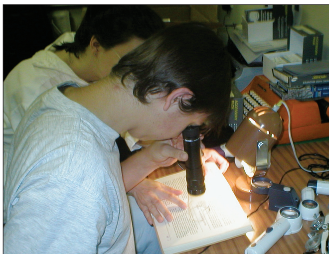
Obr. 3. Teleskop s príložnou lupou

podľa WHO a ICD-10 [9] v závislosti od binokulárnej ZO a duálnej klasifikácie príčin ZP podľa postihnutej anatomickej časti a podľa časového faktora, kedy k tomuto postihnutiu došlo tak ako navrhla Gilbertová [4]. Pri spracovaní sme použili metódy deskriptívnej štatistiky a párový t-test.