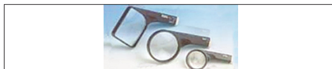
Obr. 6. Ručná lupa