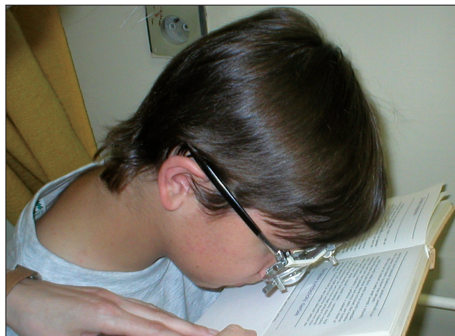
Obr. 5. Hyperokulár v skúšobnom ráme