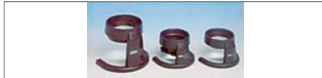
Obr. 10. Lupa stojanková – príložná, bez osvetlenia

Celkovo bolo predpísaných 171 optických pomôcok u 74 pacientov: 76 lúp – 44,4 %, 21 hyperokulárov alebo hyperkorekcií – 12,3 %, 65 teleskopov – 38 % a 9 príložných lúp k te-