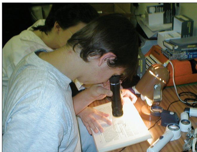
Obr. 3. Teleskop s príložnou lupou