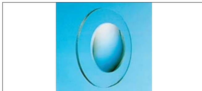
Obr. 4. Hyperokulár

podľa WHO a ICD-10 [9] v závislosti od binokulárnej ZO a duálnej klasifikácie príčin ZP podľa postihnutej anatomickej časti a podľa časového faktora, kedy k tomuto postihnutiu došlo tak ako navrhol Gilbertová [4]. Pri spracovaní sme použili metódy deskriptívnej štatistiky a párový t-test.