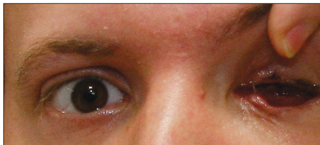
Obr. 3. Posttraumatický anoftalmus vlevo (5. den po úrazu)

Levé oko: porušený dolní slzný kanálek, tržná rána v bulbární spojivce délky 2 cm se zaschlou krustou, bez výrazného krvácení, patrná čtyři místa vbodnutí vidličky na horní mediální straně očníce, posttraumatický anophthalmus, hematoorbita.