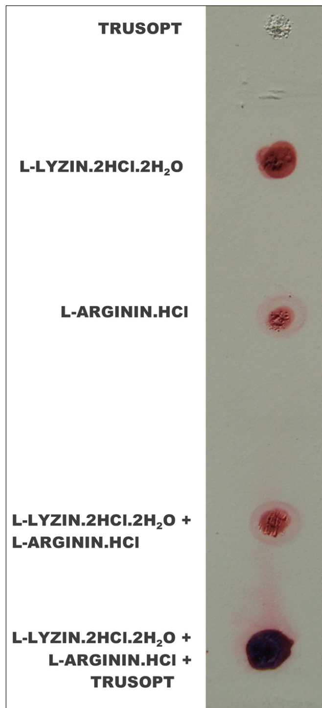
Obr. 1. Výsledok vyšetrenia ninhydrínovým činidlom na prítomnosť voľných aminokyselín a peptid na tenko vrstevnej chromatografii (vysvetlenie v texte).

toky, uvedené v kapitole Materiál a metodika, sme naniesli v množstvách 60 \mu\text{l} na tenkovrstevnú sklenenú chromatografickú platňu (Merck) a po ich vysušení teplým vzduchom sme zafarbili organickým činidlom ninhydrínom, selekčným pre voľné aminokyseliny a peptidy. Aminokyseliny lyzín a arginín ako aj ich zmesi sa farbili typicky červeno; antiglaukomatikum Trusopt neprejavil žiadnu ninhydrín pozitívnu reakciu (nefarbil sa). Zmes týchto dvoch aminokyselín s Trusoptom vykazovala odlišné fialovo modré zafarbenie, ktoré je typické pre komponenty peptidického charakteru (obr. 1).