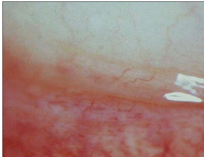
Obr. 1b. Ústup nálezu po 6 letech od ukončení léčby Cp makrolidy