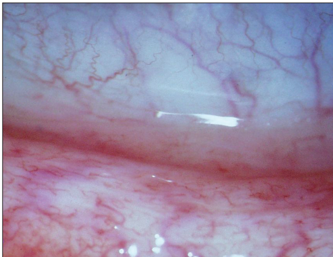
Obr. 1a. Hyperémie, prosáknutí s vinutostí cév dolního fornixu před léčbou Cp