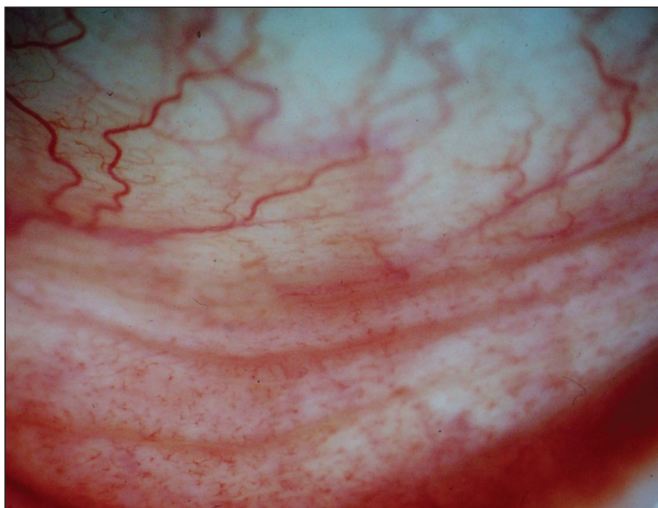
Obr. 2a. Jizevnaté změny spojivky v dolním fornixu před léčbou CP