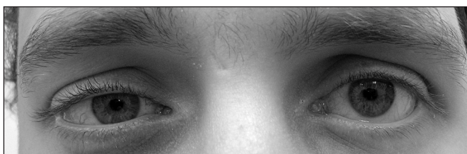
Obr. 1.1. Levostranná retrakce horního víčka u obrny n VII