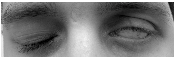
Obr. 1.2. Lagoftalmus při snaze uzavřít oční štěrbinu (House-Brackmann skóre V)