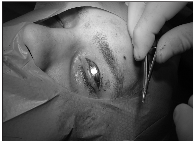
Obr. 8. Závěrečná pozice implantátu na horním víčku