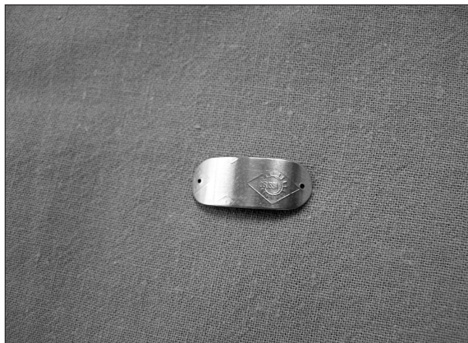
Obr. 2. Zlatý implantát – na bocích otvůrky pro zavedení stehů

Operační řez je veden v orbitopalpebrální rýze 7 až 11 mm nad margem horního víčka v délce cca 1,5 cm. Po otevření kůže a podkoží následuje preparace svěrače víčka a mobilizace přední plochy tarzální ploténky. Tarzální ploténku horního víčka obnažíme směrem dolů až k okrajům víčka. Implantát fixujeme symetricky na 2 místech k přední ploše tarzální ploténky cca do 1 až 2/3 její tloušťky. Poloha implantátu je