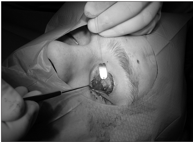
Obr. 5. Fixace implantátu k tarzu