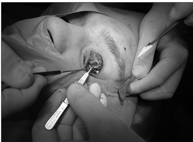
Obr. 6. Fixace implantátu k tarzu