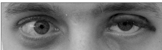
Obr. 1.4. První pooperační den s implantátem v horním víčku