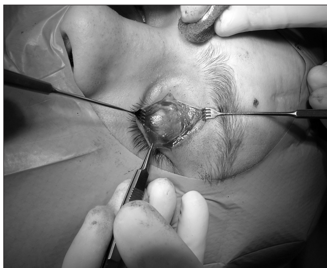
Obr. 4. Preparace podkoží horního víčka

optimální, pokud je fixován co nejnižše k tarzální ploténce. Po stabilizaci implantátu a kontrole jeho uložení adaptujeme operační ránu po jednotlivých vrstvách. Výkon končí krytím sterilním obvazem a aplikací lokálních antibiotik (obr. 3 až obr. 10).