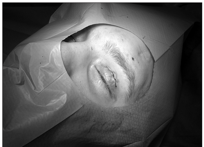
Obr. 10. Sutura víčka