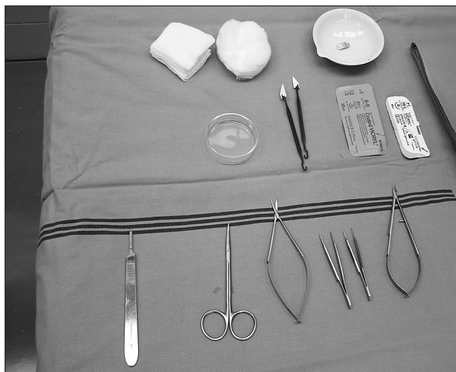
Obr. 3. Operační stolec připravený pro implantaci