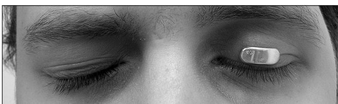
Obr. 1.3. Redukce lagoftalmu zlatým implantátem