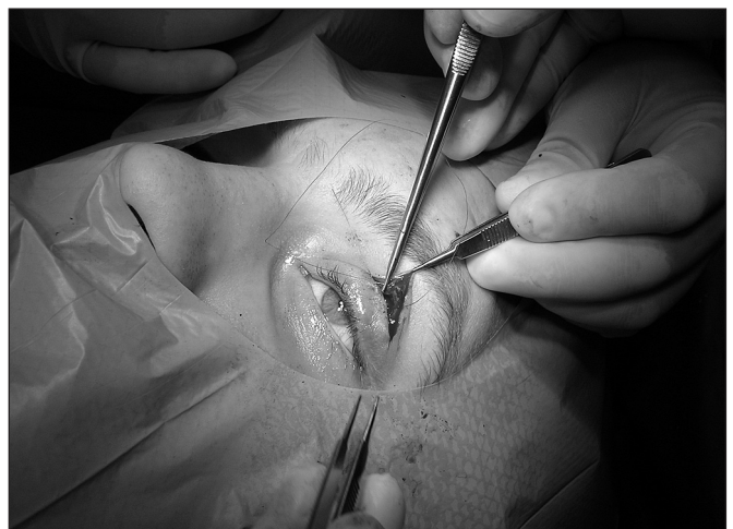
Obr. 9. Sutura podkoží