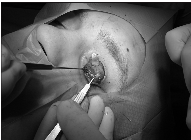
Obr. 7. Fixace implantátu k tarzu