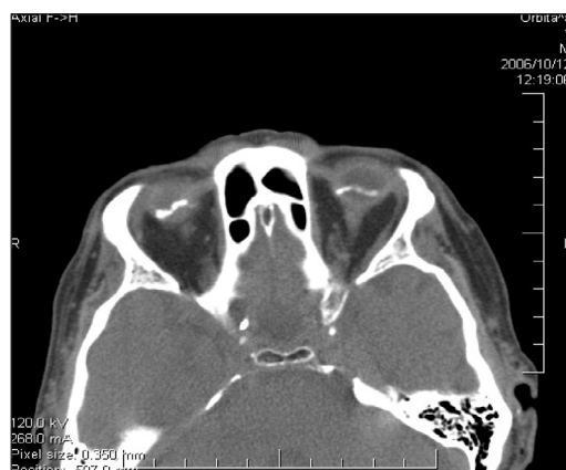
Obr. 4. CT snímka orbít s obojstranne hyperdenznými ložiskami na zadnom úseku bulbu.