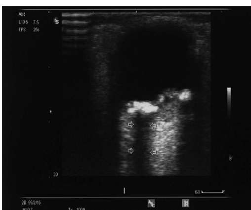
Obr. 3. USG snímka pravého oka. hyperechogenné ložisko s dorzálnym akustickým tieňom ( šípky).