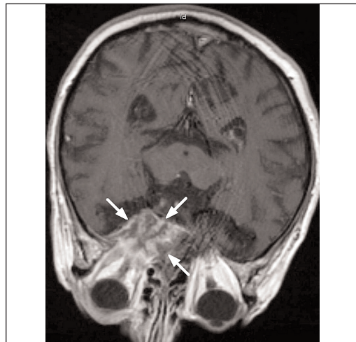
Obr. 5. MRI po 3 měsících: T1 vážený obraz po i.v. podání paramagnetické látky. Infiltrát se výrazně zvětšil, zasahuje intrakraniálně (šipky).

matologem byla snižená dávka kortikoidů (na 15 mg Prednisonu/den) a nasadili jsme antimykotickou terapii Prokanazolem (Itrakonazolom) v dávce 200 mg denně.