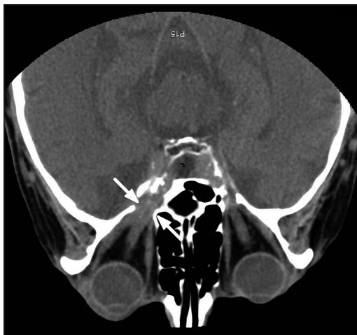
Obr. 2. Vstupní CT oční a mozku. Rozšířená fissura orbitalis superior, malý infiltrát v této lokalizaci (šipky)