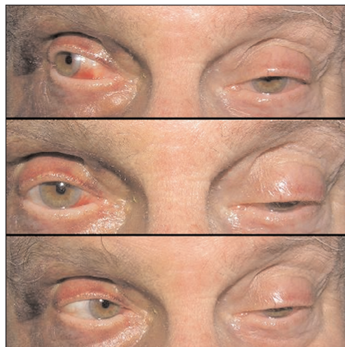
Obr. 1. Pokles víčka a omezená hybnost levého oka

Vzhledem k uvedenému nálezů byl pacient vyšetřen na Klinice ORL FN Olomouc, kde mu byla následně endonazálním přístupem provedena levostranná sphenoidotomie s odběrem materiálu na histologické vyšetření. Histologicky byly verifikovány chronické zánětlivé změněné úseky sliznic a fragmenty aspergilomu se závěrem patologa: Aspergilom levostranného sphenoidu. Po konzultaci s he-