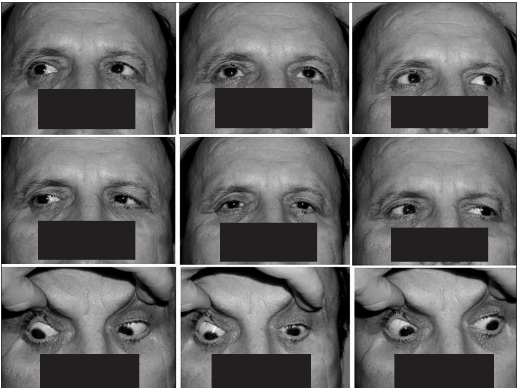
Obr. 3. Zlepšení motility bulbů, zmenšení protruze, stav po 5. infúzi infliximabu

famidem a kortikosteroidy a častým exacerbacím při snížení dávek těchto léků jsme indikovali u pacienta se zrak ohrožující Wegenerovou granulomatózou léčbu infliximabem. Před zahájením léčby bylo provedeno kompletní interní vyšetření (včetně