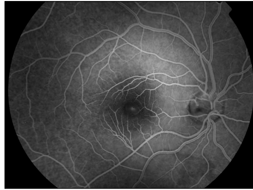
Obr. 2: Pozdní venózní fáze fluorescenčního angiogramu

Za 3 týdny po vstřebání plynné tamponády nebyla biomikroskopicky retino-