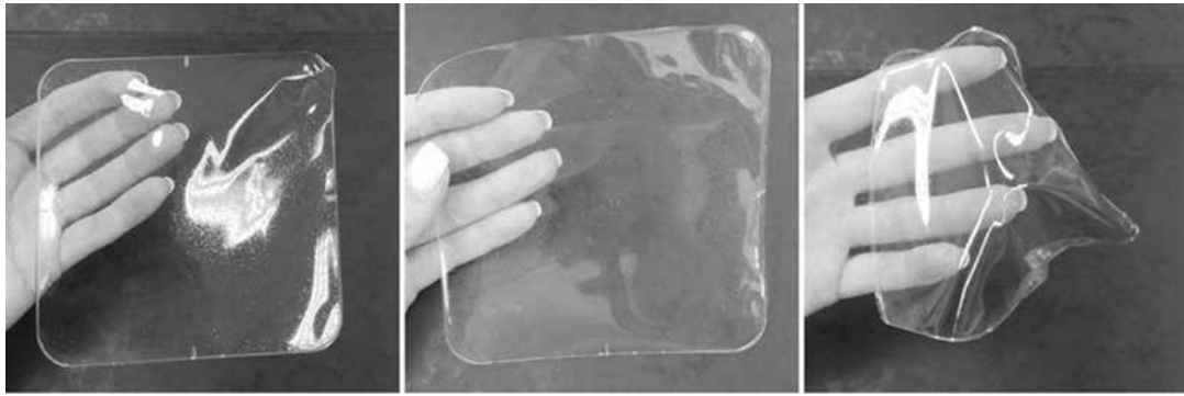
Obr. 1. Vzhled filmů 2-5G (vlevo), 2-10G (uprostřed) a 2-15G (vpravo)