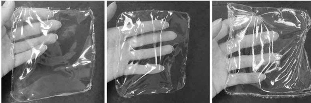
Obr. 2. Vzhled filmů 2-5G-PL (vlevo), 2-10G-PL (uprostřed) a 2-15G-PL (vpravo)