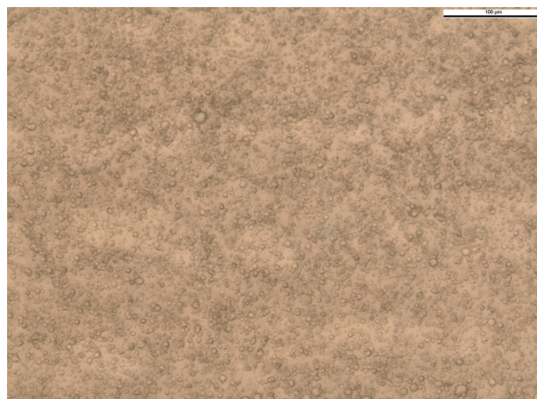
Obr. 4. Lidokainový emulgel s 5 % lidokainu, 0,6 % thymolu, s 3 % trometamolu (90. den od přípravy, zvětšení 400x)