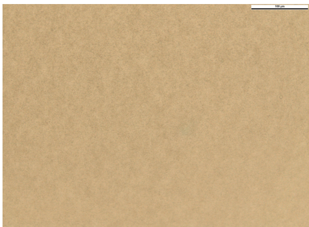
Obr. 5. EMLA krém (90. den, zvětšení 400x)