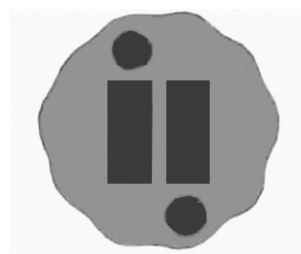
Obr. 2. Logo Interpharmy

lečnost „Interpharma“ (Interest pharmacopolaе), spol. s r. o., se sídlem v Praze II, Jungmannova 18. Jak se dovídáme, jest účelem této společnosti studovati, vypracovati a uvésti do obchodu nová, chemicky jednotná a specifická léčiva. Takovou práci hodlá Interpharma přispěti k výrobnímu rozvoji našeho domácího farmaceutického průmyslu. Dlouholetá zkušenost vedoucích sil v tomto oboru a mnohostranná úzká spolupráce s vědeckými kruhy vysokých škol i z praxe lékařské a lékárnické slibuje splnění vytyčených snah ... Československé farmaceutické výrobě bude založení společnosti tohoto rázu jistě jen prospěšno a přejeme Interpharmě k její práci plného zdaru!“ 5 (obr. 2).