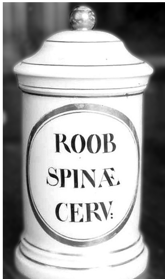
Obr. 3. Porcelánová stojatka na Roob spinae cervi (zavařenina z plodů řešetláku)

Do krabiček se vyléval rozvařený kdoulový gel Panis cydoniorum seu Marmelada simplex nebo jeho varianta ochucená práškovaným kořením Panis cydon. aromatisatus . Vedle různých povidel (např. Pulpa prunorum ) měly podobný charakter Passulae laxantes (projímavé hrozinky) připravené vařením hrozinek v odvaru ze sennových listů a koření. Rektálně se podával přípravek Pulpa cassiae pro clysteribus , jež se připravoval z kassiových povidel, z odvaru z dalších drog a z cukru.