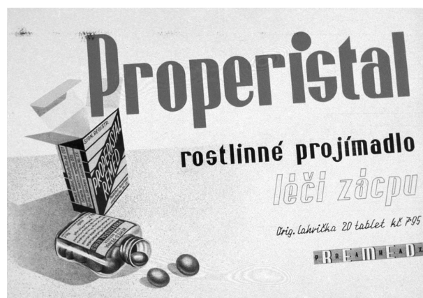
Obr. 7. Leták fy Remed na tablety Properistal 1936, ČFM

Jinou formou sponzoringu je udělení různých cen a stipendií, jak je zřejmé z citace: „Československá lékárnická společnost ve své snaze vzbuditi zájem o původní tvorbu lékárnickou, vypisuje V. soutěž o ceny o celkovém obnosu 3.000 Kč. Součástí této soutěže byly i ceny