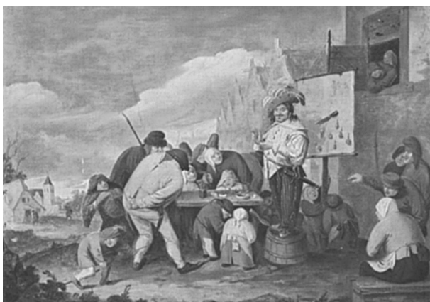
Obr. 1. Mastičkář – malba Adriana Browera, Staatl. Kunsthalle Karlsruhe. Prospekt fy „Bayer“, Leverkusen, asi 1939–1945, České farmaceutické muzeum (ČFM)

noviny Český postilion neboližto Noviny České , vycházely od roku 1719. Už v 18. století pravidelně vydávané anglické listy obsahovaly inzerci, vždy ve dvou až třech sloupcích na konci novin.