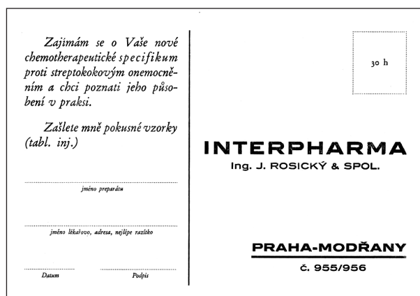
Obr. 4. Dopisnice fy Interpharma, Praha – Modřany; po roce 1932, ČFM

roku 1855, kdy Pharmacopoea Austriaca V. povolila lékárnám nákup továrně vyrobených chemických léčiv. Počátek 19. století přinesl nové převratné prvky. Byl to především růst chemického průmyslu a s ním i průmyslové výroby chemických léčiv, která pak během 19. a začátkem 20. století dokázala zlikvidovat malo-výrobu lékárenskou. Lékárny a průmysl se dostaly do postavení vzájemných konkurentů. Do vyostřenějších konkurenčních vztahů se dostaly i lékárny mezi sebou, hlavně ve větších městech. Konkurenční boj probíhal jednak v oblasti cenové, tak i rozvojem reklamy. Postupně se objevil nový fenomén, lékárny vyráběly nejen přípravky dle lékařského předpisu, ale i vlastní léková komposita, tzv. domácí speciality. První speciality se objevily už ve 14. století, nejstarší známou specialitou u nás byl Oleum balsami Magistri Galli de Monte Syon kanovníka a lékaře Mistra Havla ze Strahova, žijícího za vlády Karla IV. V 18. století již speciality nebyly ojedinělým jevem, jejich složení bylo často tajeno, tyto přípravky se nazývaly arcana (z lat. arcanum – tajemství). Výroba a prodej arcan byla v Rakousku zakázána již v roce 1775, zákaz byl bezvýsledně opakován a obnovován mnoha dalšími dvorskými patenty a výnosy, vycházely seznamy tajných léků, které byly zdravotními úřady zakázány.