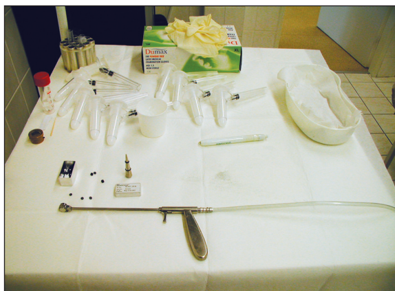
Obr. 1. Instrumentarium Fig. 1. Instrumentation