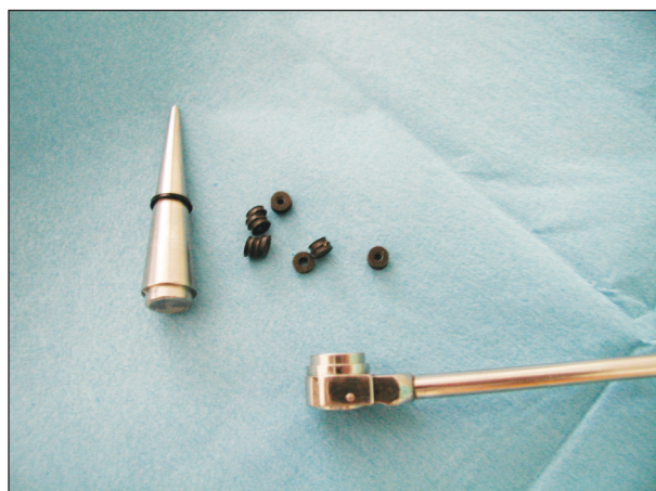
Obr. 2. Detail aplikátoru Fig. 2. Applicator – a detail