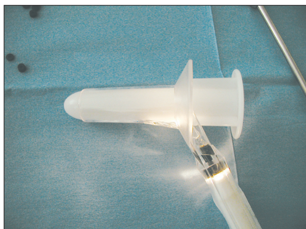
Obr. 3. Anoskop Fig. 3. Anoscope