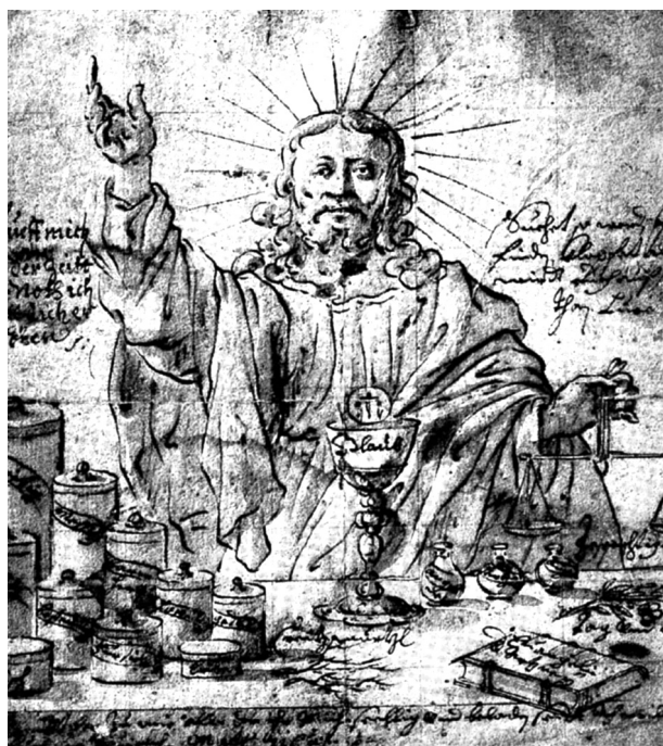
Obr. 1. Kristus jako lékárník

Antické ochránce zdraví a patrony zdravotníků, boha Asklépia a jeho známější dcery Hygieiu a Panakeu, vystřídal v křesťanské éře Bůh otec, ale především jeho syn Kristus jako nebeský léčitel duší a ochránce lékařů a lékárníků, strážců zdraví a léčitelů nemocných živých těl. K ruce mu byli křesťanští světci Pantaleon, Rochus, Šebestián, ale zejména bratři Kosma a Damián. Ti poslední působí v roli symbolických patronů našich