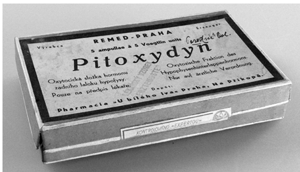
Obr. 4. Pitoxydyn inj. – originální přípravek (před 1939) označený páskou >Kontrolováno „Expertou“<