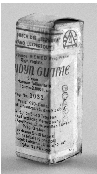
Obr. 6. Femidyn guttae, registrační číslo 3032; originální přípravek kontrolovaný Expertou (po 1942)