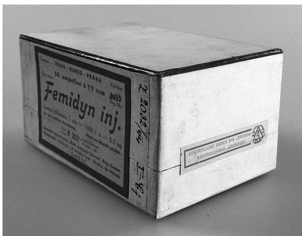
Obr. 5. Femidyn inj., registrační číslo 3033; originální přípravek >Kontrolováno „Expertou“<; kontrolní vzorek Ústavu pro zkoumání léčiv z roku 1944

8. Experta do své kontroly zásadně nezařadila, tzv. arkana (tajné léky), dále pak LP, které byly v ČSR zamítnuty, a LP, u kterých bylo zřejmé, že se nevyznačují přednostmi, které požaduje vládní nařízení o specialitách. Dále do seznamu Experty nemohla být zahrnuta tzv. komposita.