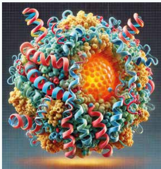
Obr | Molekula lipoproteínu(a)

Lp(a) sa správa ako aterogénny lipoproteín, ktorý podporuje tvorbu aterosklerotických plakov v stenách ciev. Obsahuje cholesterolové estery a oxidované fosfolipidy, ktoré sa hromadia v endotelových bunkách a podporujú zápal a poškodenie cievného endotelu. Tieto pláty narúšajú normálny