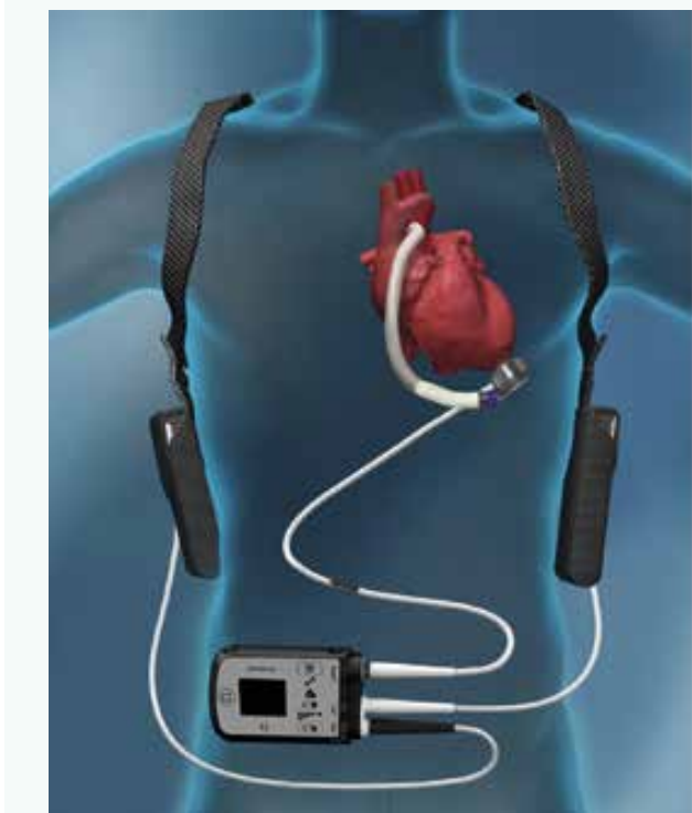
Obr | Mechanická srdeční podpora HeartMate 3