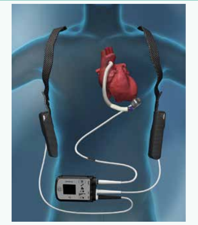
Schéma | Vliv implantace mechanické srdeční podpory (Heart Mate II nebo 3) a cévních parametrů (pulzilitního indexu v karotických tepnách a augmentačního indexu) na klinické příhody (median sledování 27 měsíců)