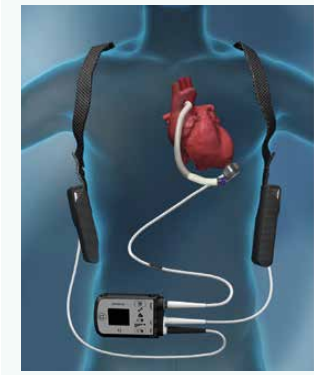
Obr | Mechanická srdeční podpora HeartMate 3