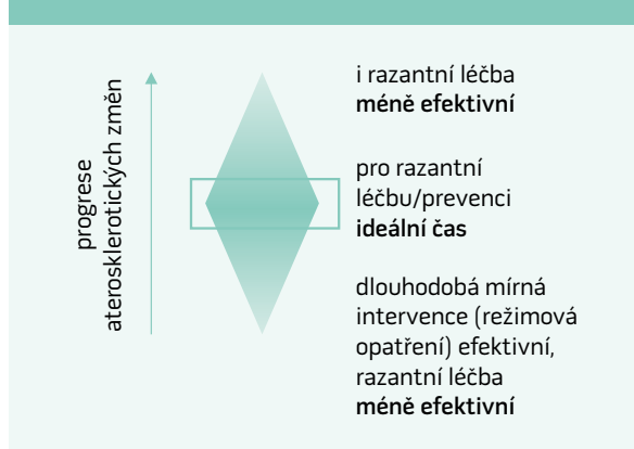
Schéma 2. Léčebné možnosti dle různých stadií aterosklerotického procesu